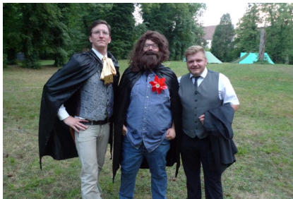
Hier ein Bild mit Freunden

Ob diese Enthüllung daran liegt, das der Klitterer bereits mehrfach diesen Umstand vermutet hat, ist nicht ganz auszuschließen.