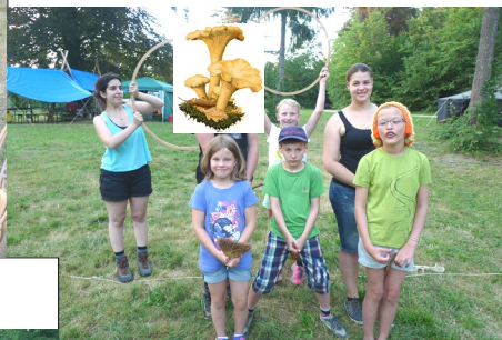
Die stinkenden Einhörner